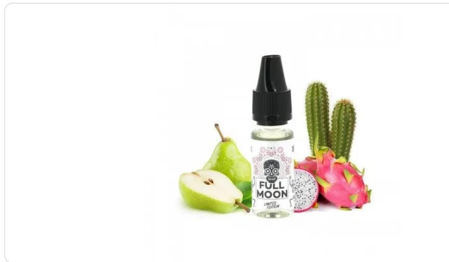
Pilt 1 Toote saadavus kauplustes

Tartu Rüütli: 0 tk Pärnu Rüütli: 2 tk Balti Jaama Turg: 2 tk Tabasalu: 2 tk Rannarootsi: 3 tk Valka: 0 tk Lisa võrdlusesse