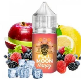
Pilt 3 Toote saadavus kauplustes