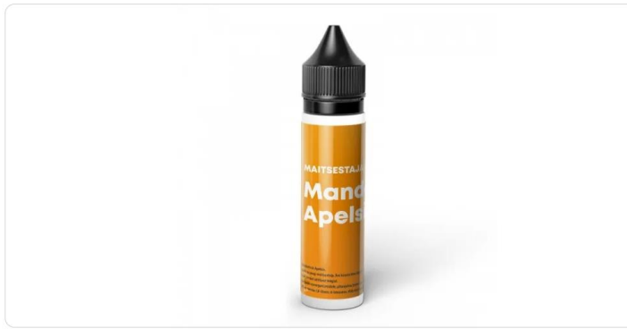
Pilt 2 Toote saadavus kauplustes

Tartu Rüütli: 2 tk Pärnu Rüütli: 1 tk Balti Jaama Turg: 0 tk Tabasalu: 1 tk Rannarootsi: 0 tk Valka: 0 tk