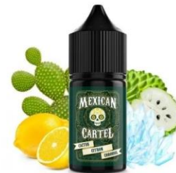
Pilt 4 Toote saadavus kauplustes